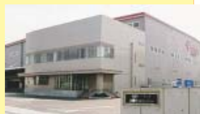
（ベイシア前橋流通センター）

JA高崎ハム工場 ：HACCP（ハサップ）システムを導入し、徹底した衛生管理のもとで、ハム、ソーセージ等食肉製品の製造を行っています。最新の設備が導入された工場内を見学します。