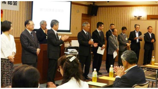
新しい役員体制が発表されました