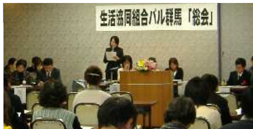
渋川市生協(上)とパル群馬(下)の合併総会