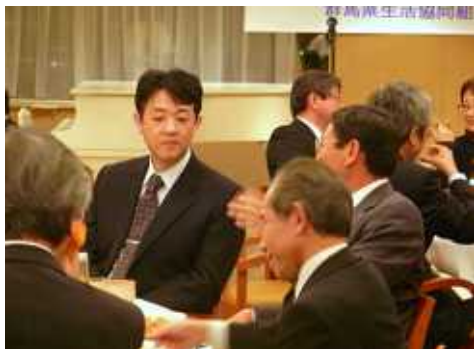
行政・生協懇談会のようす

恒例となっている「行政・生協懇談会」が4月17日、群馬ロイヤルホテルを会場に開催されました。この懇談会は、群馬県の人事異動後のこの時期に、群馬県生協連（本部：前橋市）が主催し、日頃指導・協力をいただく群馬県関係部局の皆さんと、県内生協の理事長をはじめとする役職員の皆さんとの交流・懇談を行なっているものです。今年は県の組織変更があつて初めての懇談会でした。